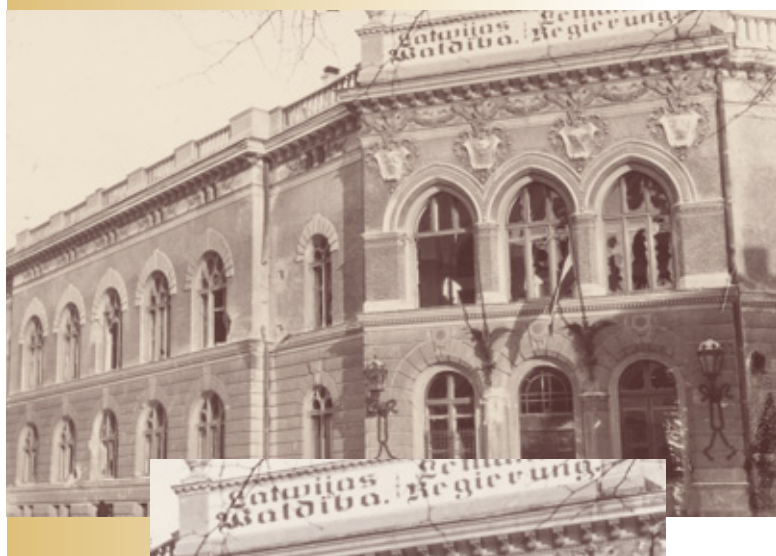
Skats uz Latvijas valdības ēku pēc ciņas ar bermontiešiem (1919. gada novembris, V. Rīdzenieka foto, LV KFFDA)