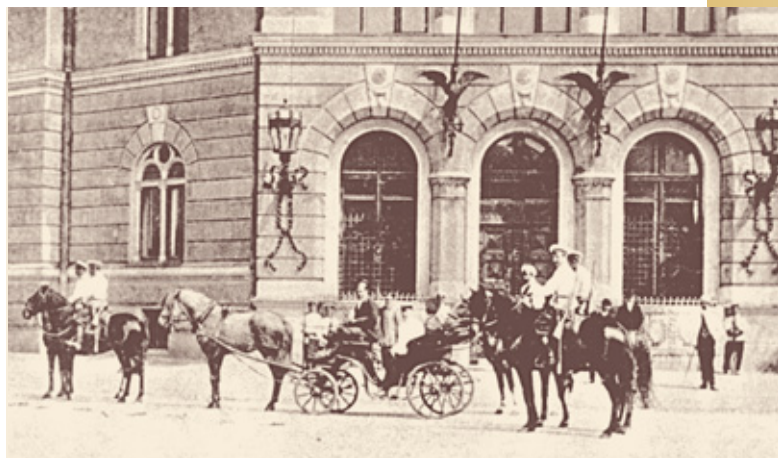
Naudas transportēšana no Krievijas Valsts bankas Rīgas kantora uz pastu. (20. gs. sākums)

Ēkas pagalmā tika uzcelta palīgēka, kurā izvietoja stalli, ratnīcu un veļas mazgātavu. Īpaši drošības pasākumi tika lietoti, lai novērstu iespējamo ugunsgrēku vai aplaupšanu kases telpās, kuras bija ierīkotas ar aprēķinu, lai vēlāk papildinātu ar seifiem. Visās bankas telpās griesti un sienas bija celtas no nedegošiem materiāliem – ķieģeļiem un dzelzsbetona (Latvijas Banka bija viena no pirmajām būvēm Latvijā, kurā izmantots dzelzsbetons), jumts pilnībā veidots no dzelzs konstrukcijām.