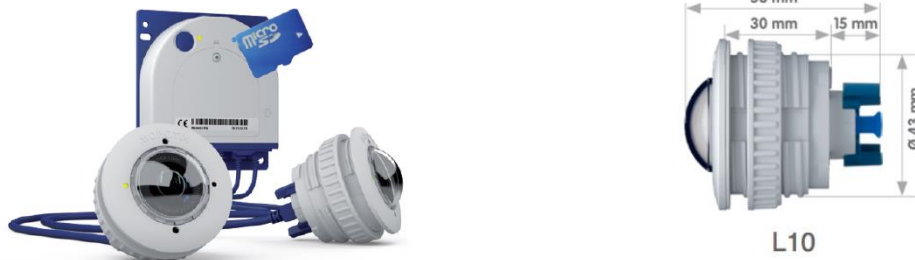
2. attēls. Videokamera S16B Dual Flex ar iznestiem objektīviem.

5. Slūžas aprīko ar pamatni iznesto objektīvu Mx-O-SMA-S-6D016 montāžai. Objektīvu pieslēgšana tiks veikta ar Mobotix kabeļiem MX-FLEX-OPT-CBL Series Cable (katram objektīvam atsevišķs kabelis). Videokameras objektīva pamatnei jābūt ar pietiekamu telpu objektīva korpusam un pievienotajam kabelim. Pievienojuma kabelis aprīkots ar spraudni. Spraudņa izmēri ar kabeli (ievērojot kabeļa liekuma rādiusu) D=15\text{mm} ; L=60\text{mm} .