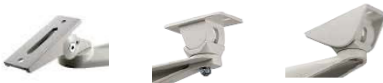
1. ilustratīvais attēls. Stacionāro videokameru kronšteinu gala elementu piemēri.