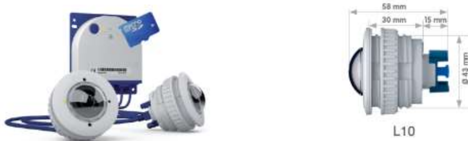
2. attēls. Videokamera S16B Dual Flex ar iznestiem objektīviem.

5. Slūžas aprīko ar pamatni iznesto objektīvu Mx-O-SMA-S-6D016 montāžai. Objektīvu pieslēgšana tiks veikta ar Mobotix kabeļiem MX-FLEX-OPT-CBL Series Cable (katram objektīvam atsevišķs kabelis). Videokameras objektīva pamatnei jābūt ar pietiekamu telpu objektīva korpusam un pievienotajam kabelim. Pievienojuma kabelis aprīkots ar spraudni. Spraudņa izmēri ar kabeli (ievērojot kabeļa liekuma rādīus) D=15\text{mm} ; L=60\text{mm} .